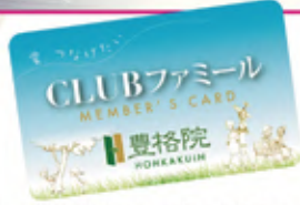
豊格院CLUBファミリー会員カード