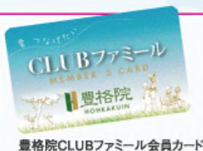
豊格院CLUBファミリー会員カード