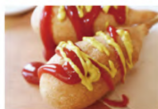
アメリカンドック